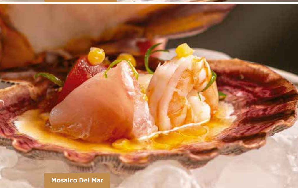
Mosaico Del Mar