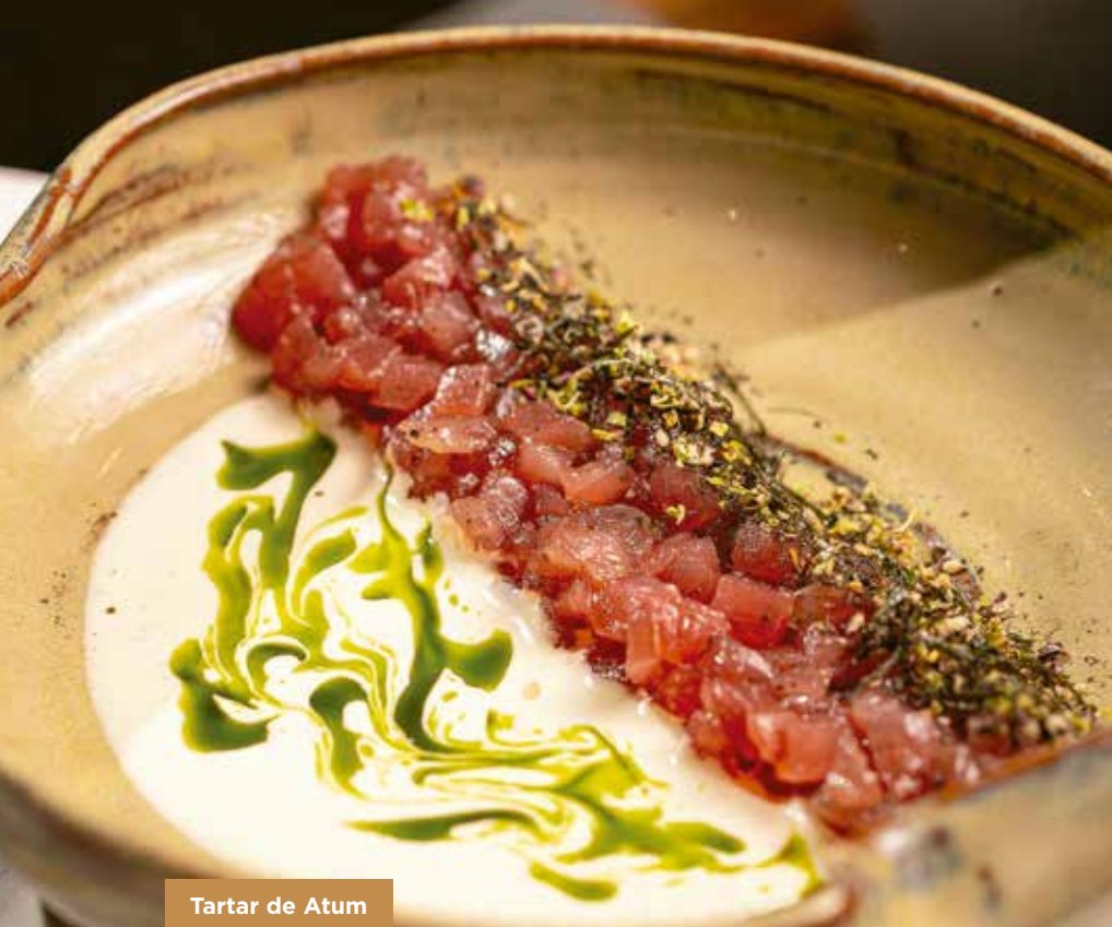
Tartar de Atum