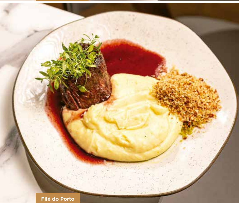
Filé do Porto