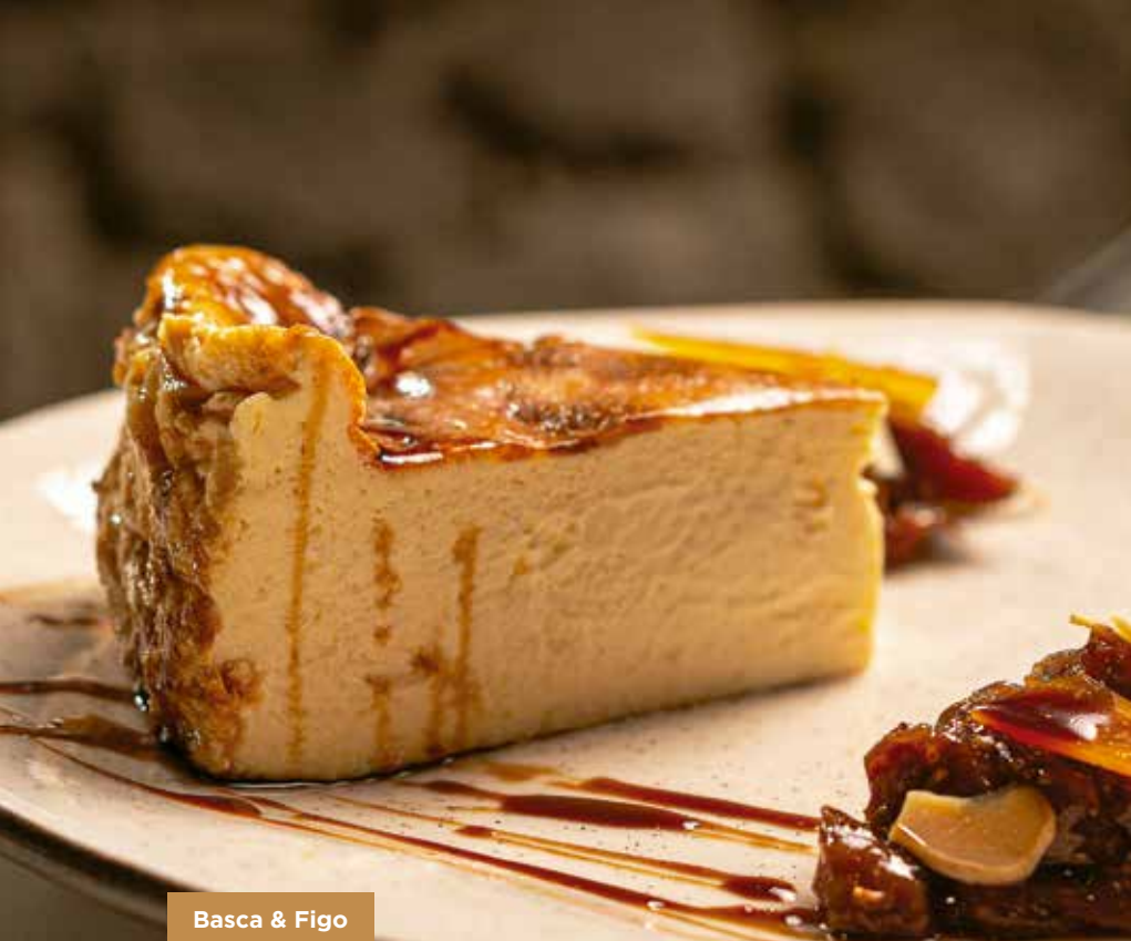
Basca & Figo