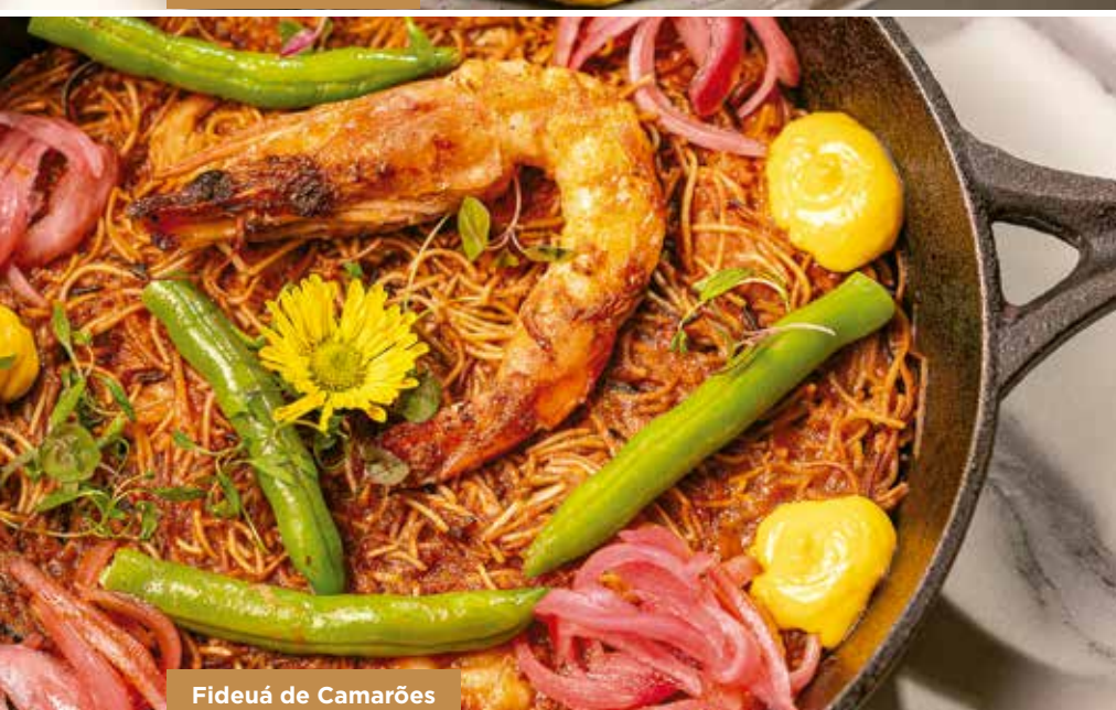
Fideuá de Camarões