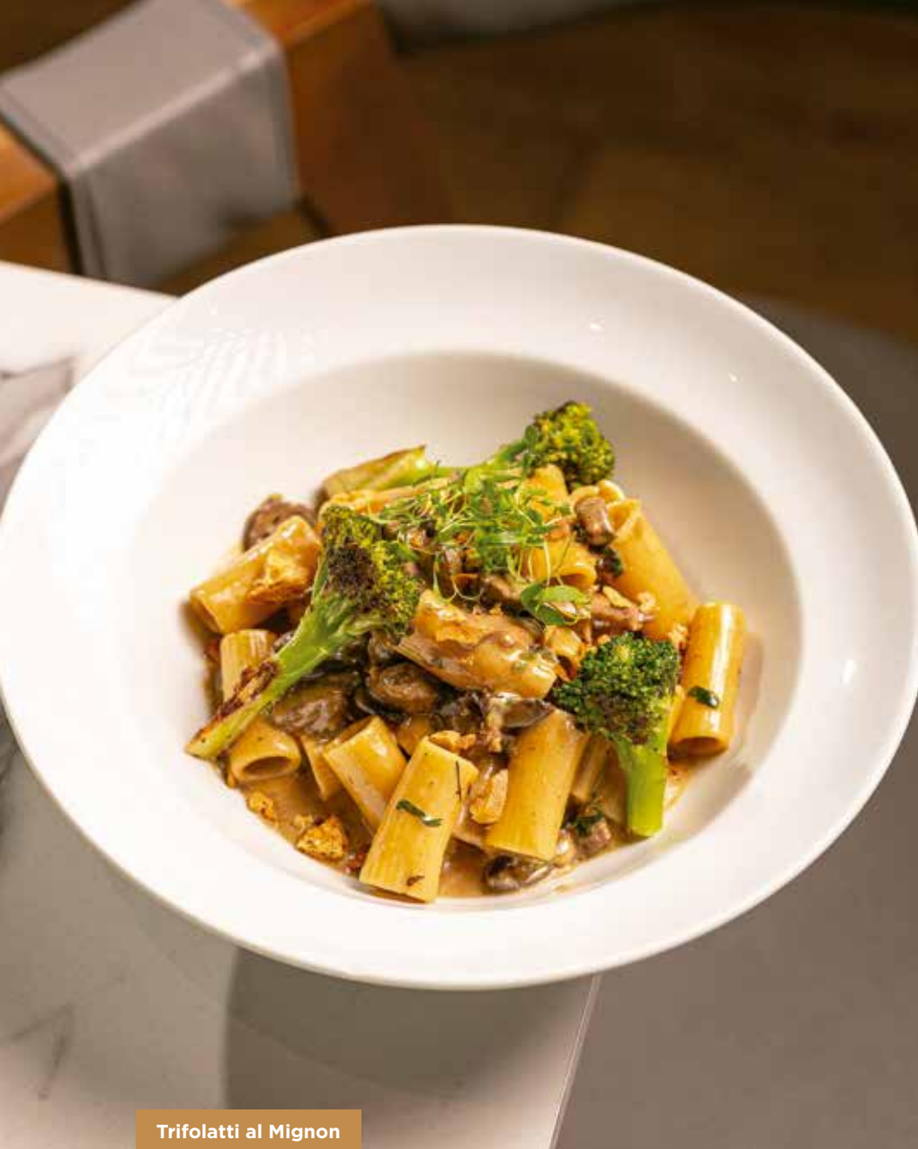
Trifolatti al Mignon