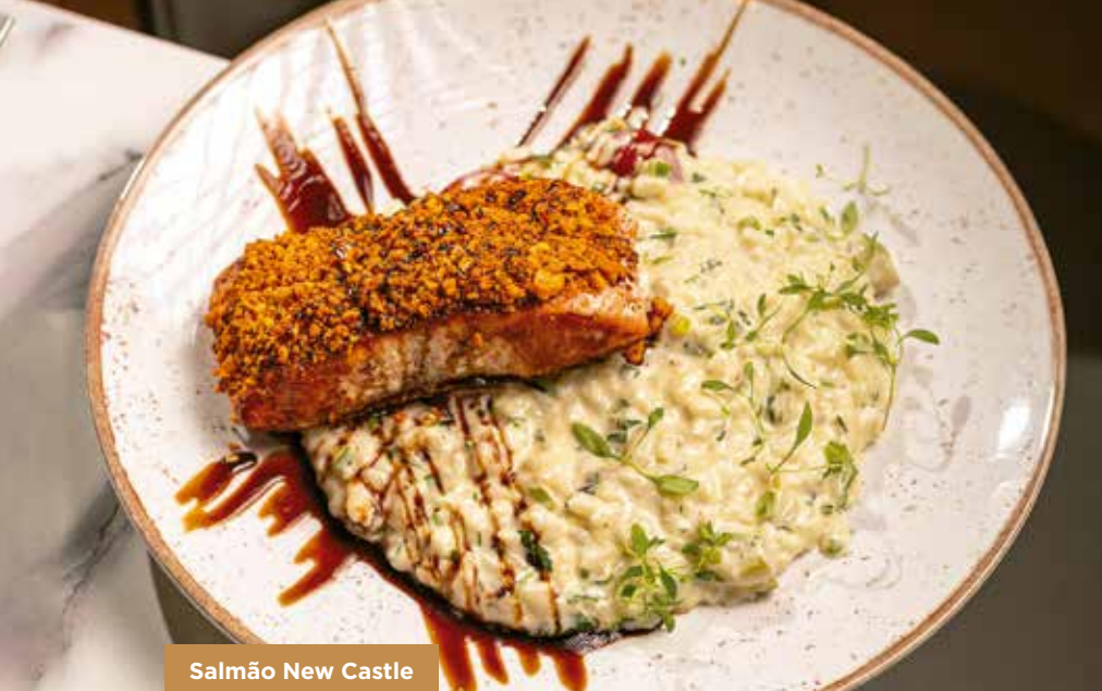
Salmão New Castle