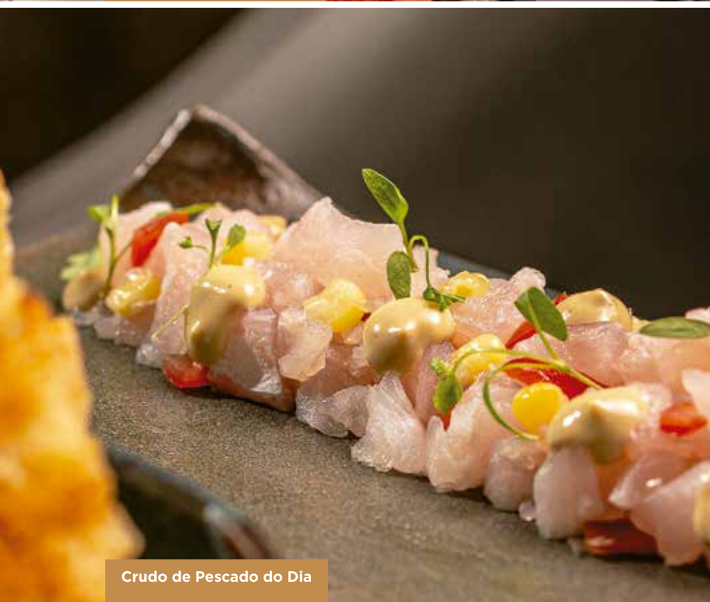
Crudo de Pescado do Dia