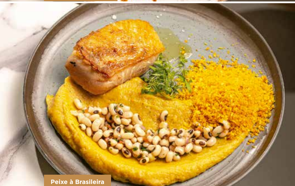
Peixe à Brasileira